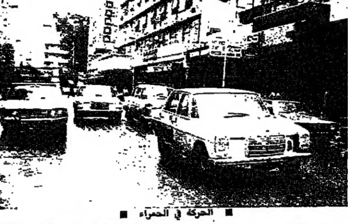
الحركة في الحمراء